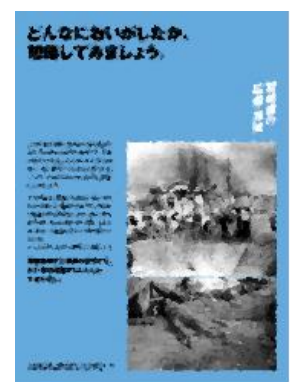
⑥ どんなにおいがしたか、想像してみましょう。