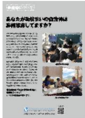
⑭ あなたのお住まいの自治体は非核宣言してますか?