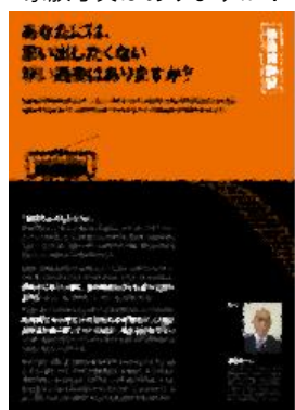
⑨ あなたには思い出したくない、辛い過去はありますか?