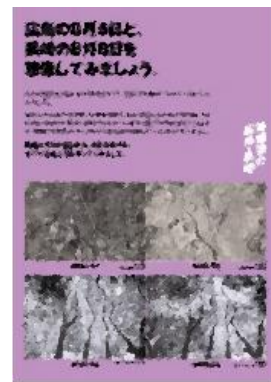
⑤ 広島の日と、長崎の日を想像してみましょう。