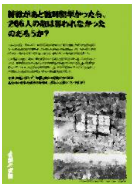
⑩ 終戦があと数時間早かったら、266人の命は奪われなかったのだろうか?