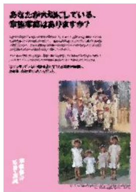
③ あなたが大切にしている、家族写真はありますか?