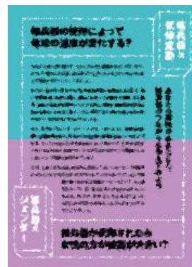
⑮ 核兵器の使用によって地球の温度が変化する?