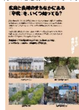
⑪ 広島と長崎のまちなかにある「平和」を、いくつか知ってる?