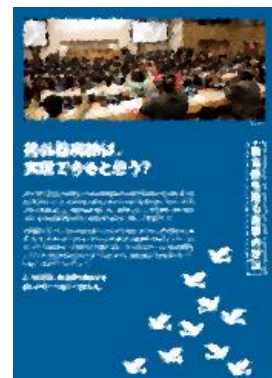
⑬ 核兵器廃絶は、実現できると思う?