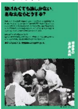
⑧ 助けたくても油しくない、あなたならどうする?