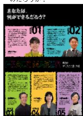
⑯ あなたは、何ができるだろう?