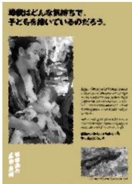
⑦ 母はどんな気持ちで、子どもを抱いているのだろう。