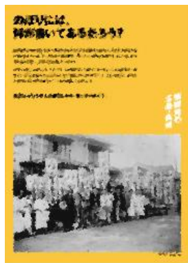
④ のぼりには、何が書いてあるだろう?