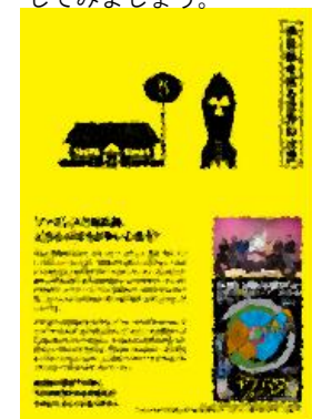
⑫ ファミレスと核兵器、どちらのほうが多いと思う?